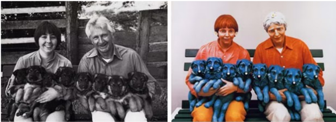
Photograph: Art Rogers – 1985; Polychrome: Jeff Koons – 1988

(alt_description=“fotos una al lado de la otra de la fotografía de Art Rogers y la estatua de Jeff Koons”)